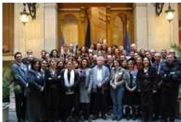
Photo de groupe des 56 centres d'information EUROPE DIRECT en France

Journées de formation des 19 et 20 janvier 2009 à la Représentation de la Commission européenne à Paris.